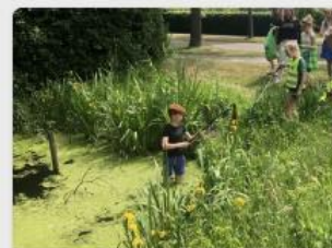
Verfrissende beloning na warme opruimactie