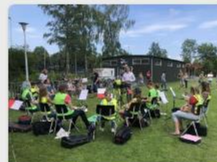
Een muzikale opruimactie met Brassband Pro Rege