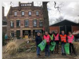
It Pakhûs zet zich in voor een schoon Akkrum!