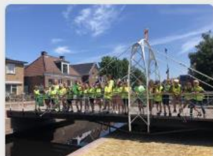
OBS De Boarne zet zich in voor een schoon Aldeboarn!