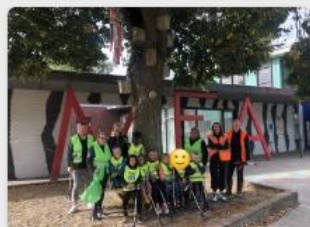
KC Skoatterwiis in Oudeschoot: als rovers door de struiken