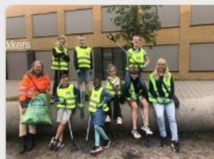
Winkelcentrum de Akkers knapt op door OBS Route 0513