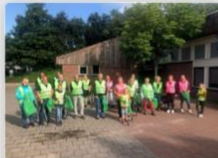
Samen op pad in Haskerdijken en Nieuwebrug