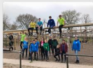
Run op zwerfafval in de Knipe!