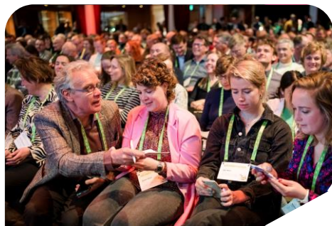
Gemeentelijk Grondstoffencongres 30 maart 2023