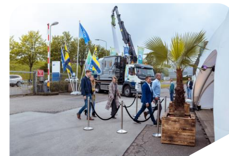
NVRD Jaarcongres 10 en 11 mei 2023