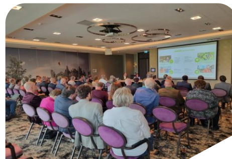
Algemene Ledenvergadering 10 mei en 7 december 2023