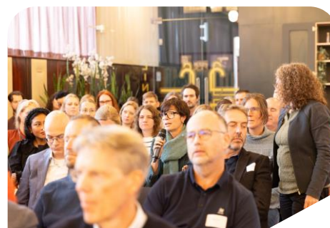
VANG GFT-congres 31 oktober 2023