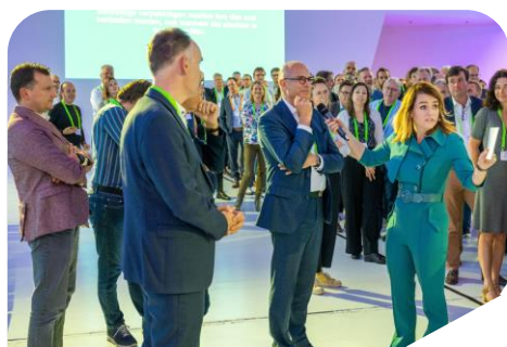
Afvalconferentie 4 oktober 2023