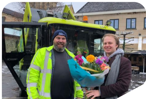
Week van de AfvalHelden 6 t/m 12 maart 2023