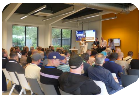
Vakdag 28 juni 2023